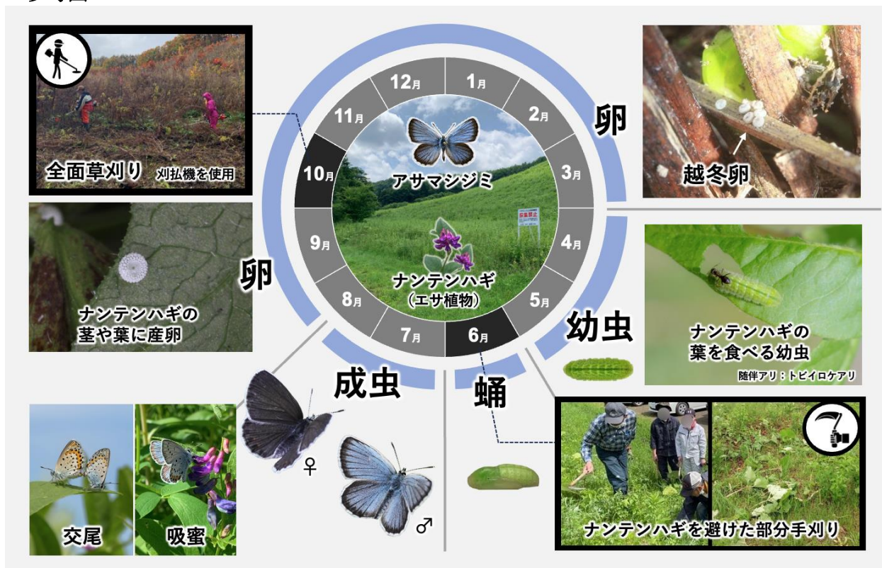
図1 研究概要 (アサマシジミ北海道亜種の生活サイクルを踏まえた草刈り時期と方法)