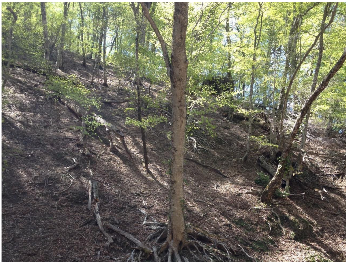
図1 芦生研究林における林床の写真。シカが好む植物はほとんど生育できていない。これと同様の現象が全国各地で起きている。