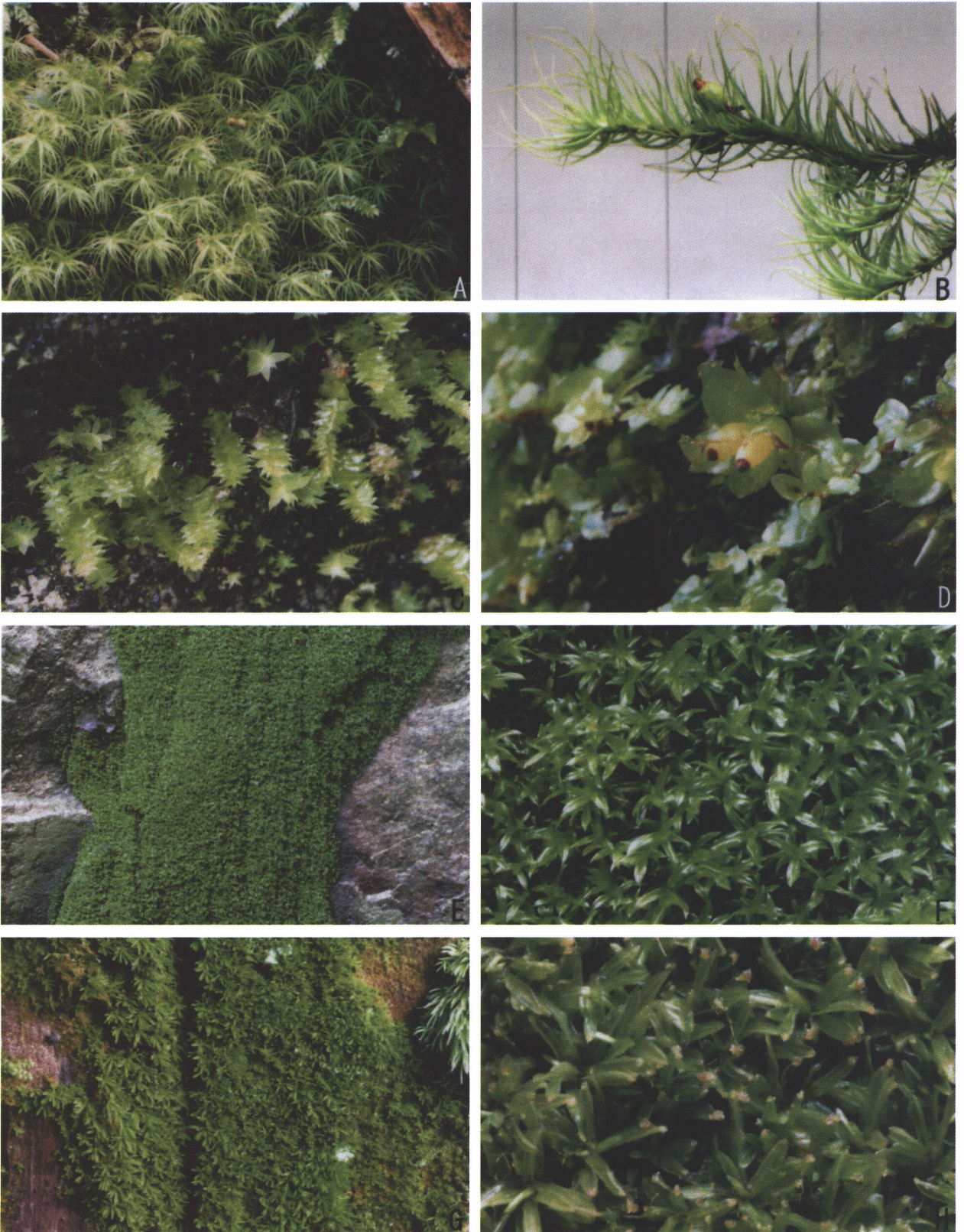
図版 1 A, B. クモマタマゴケ Bartramia halleriana Hedw. C. コキシノオゴケ Cyathophorella hookeriana (Griff.) M.Fleisch. D. タチチョウチンゴケ Orthomnion dilatatum (Mitt.) P.C.Chen. E, F. ホンモンジゴケ Scopelophila cataractae (Mitt.) Broth. G, H. ヒメイサワゴケ Syrrhopodon fimbriatulus Mull.Hal.