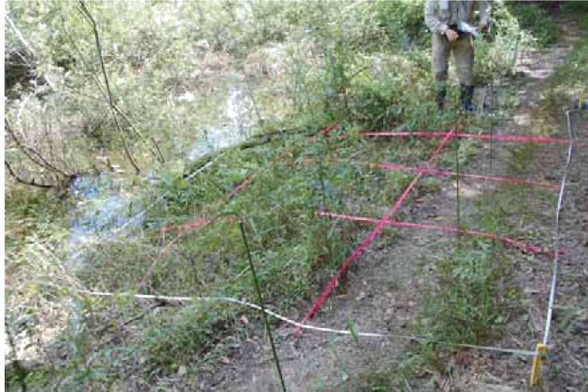
写真1 ヒメヘビイチゴ生育地（2010年7月21日撮影）