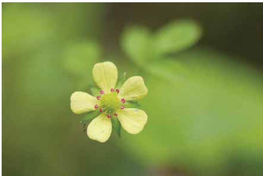
写真3 ヒメヘビイチゴの花の拡大（2010年6月8日撮影）