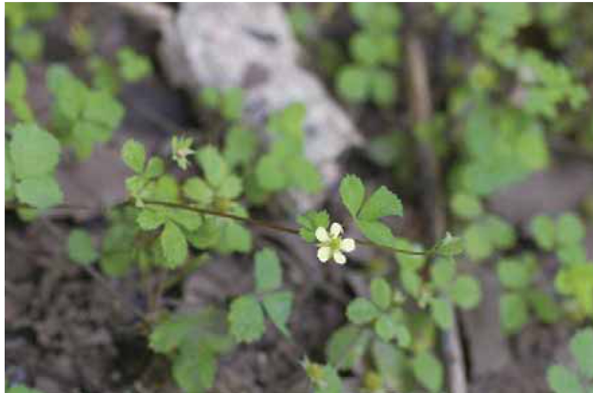
写真2 ヒメヘビイチゴの全形（2010年6月8日撮影）