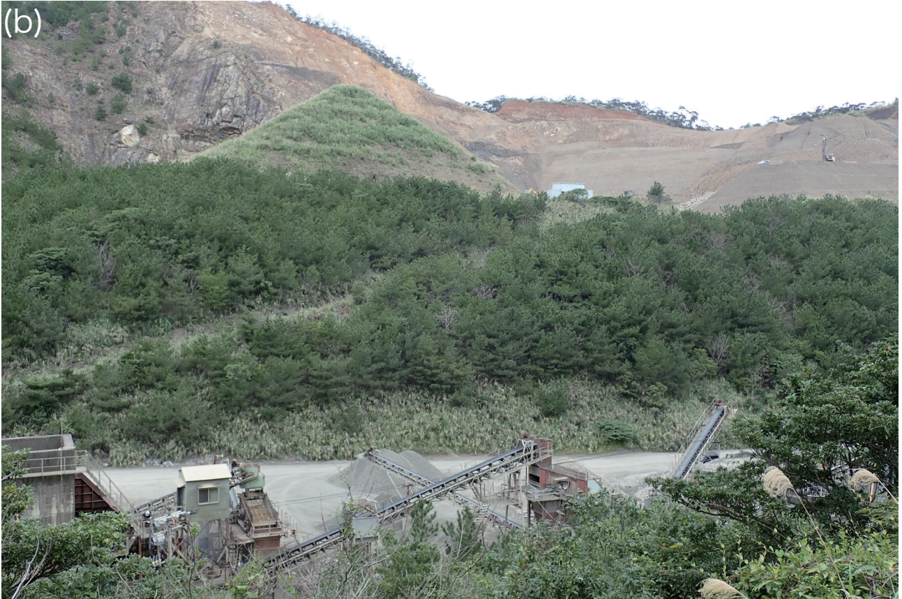
図 3 再生マツ林. (a) 法面でリュウキュウマツ低木が優占している. (b) 土取り場周辺でリュウキュウマツ低木・亜高木が優占している. 撮影日および撮影地: 2022 年 2 月 7 日, 大島郡瀬戸内町.