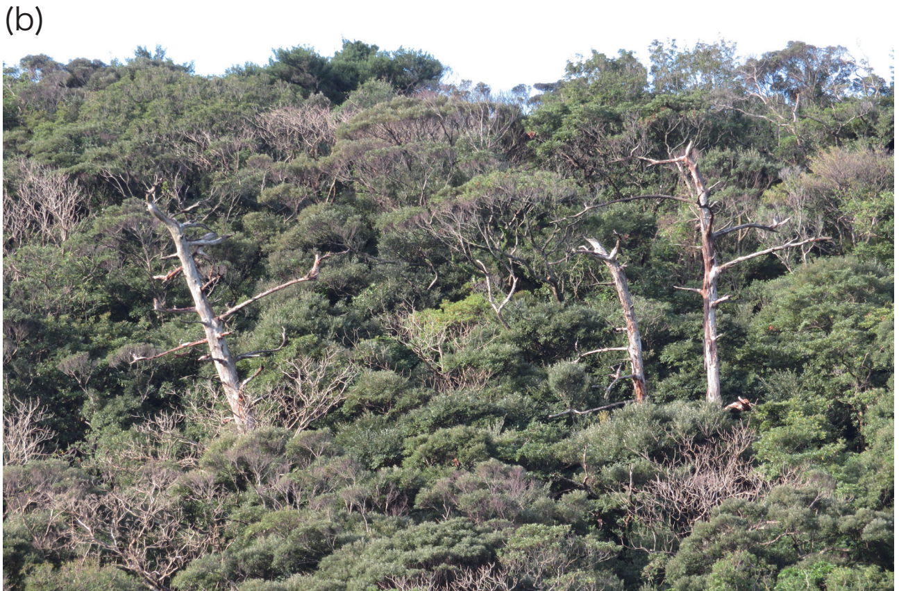
図4 枯損マツ林。(a) 白骨化したリュウキュウマツの主幹が点在している。(b) 枯れたリュウキュウマツに代わり広葉樹が繁茂している。撮影日および撮影地:(a) 2022年2月7日, 奄美市笠利町;(b) 2022年2月8日, 奄美市住用町。