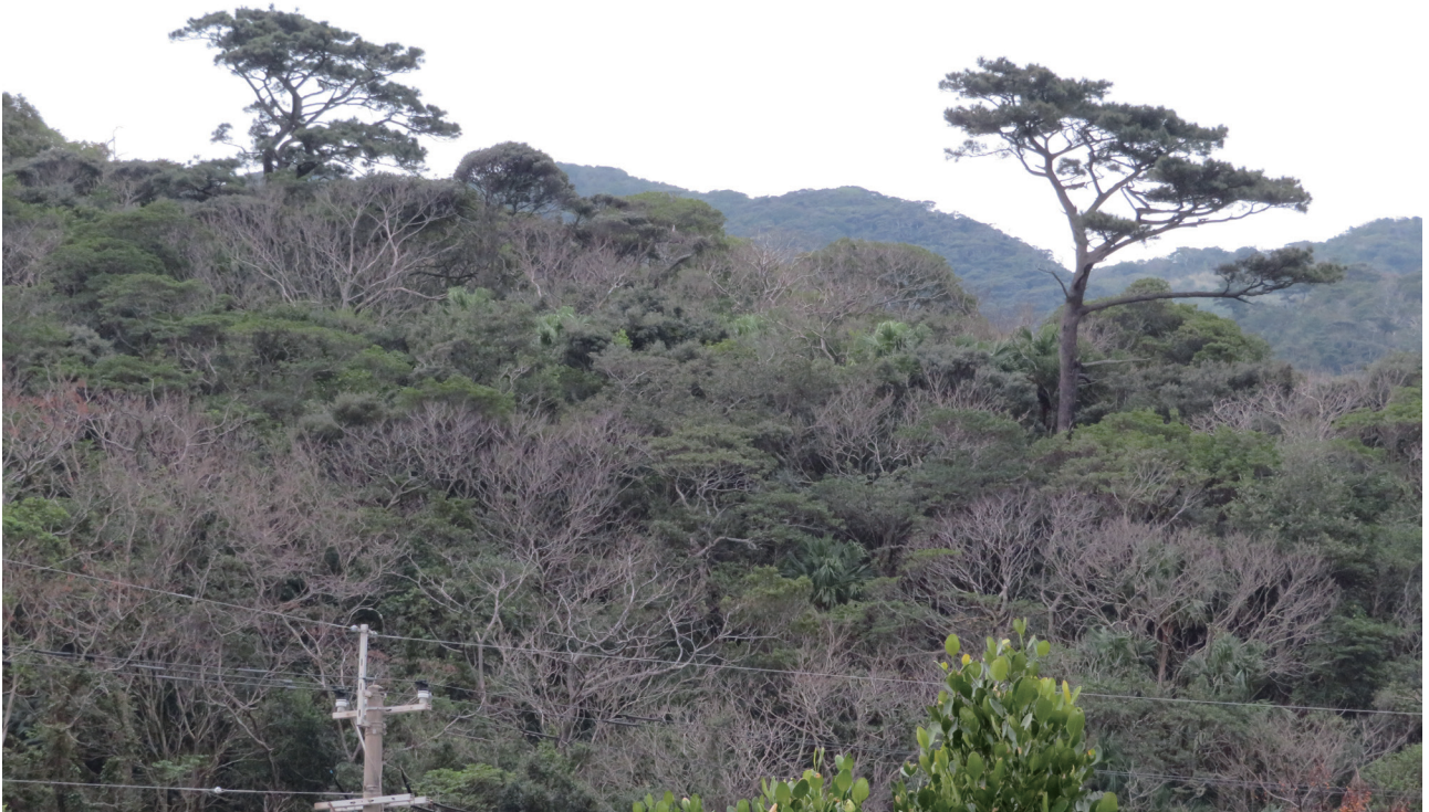
図2 残存マツ林。(a) 尾根部にリュウキュウマツ高木が残存し、下部の法面にリュウキュウマツ低木が生育している。(b) 尾根部にリュウキュウマツ高木が残存している。撮影日および撮影地: 2022年2月7日, 大島郡宇検村。