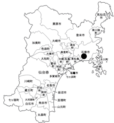
図1 宮城県石巻市(右図)ならびにトヤケ森山(左図)の位置。黒い丸はセンサーカメラを設置した位置を、小さな点は短期間のみ設置したカメラの位置を、それぞれ示す。等高線の間隔は10 m。