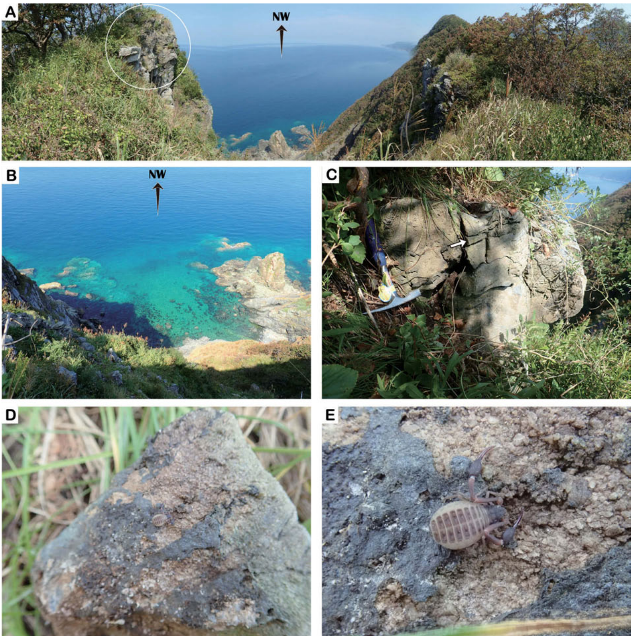
Figure 2. Field photographs of the sampling location of the pseudoscorpion. All photos were taken on August 28, 2020.

A, Sea cliff crest with sampling location of the pseudoscorpion (white circle); B, Panoramic view from the sampling location on the sea cliff crest; C, Outcrop where the pseudoscorpion was collected. Rock mass surrounded by open fractures are indicated by a white arrow; D, The pseudoscorpion on the surface of an open crack; E, Enlargement of Fig. 2D.