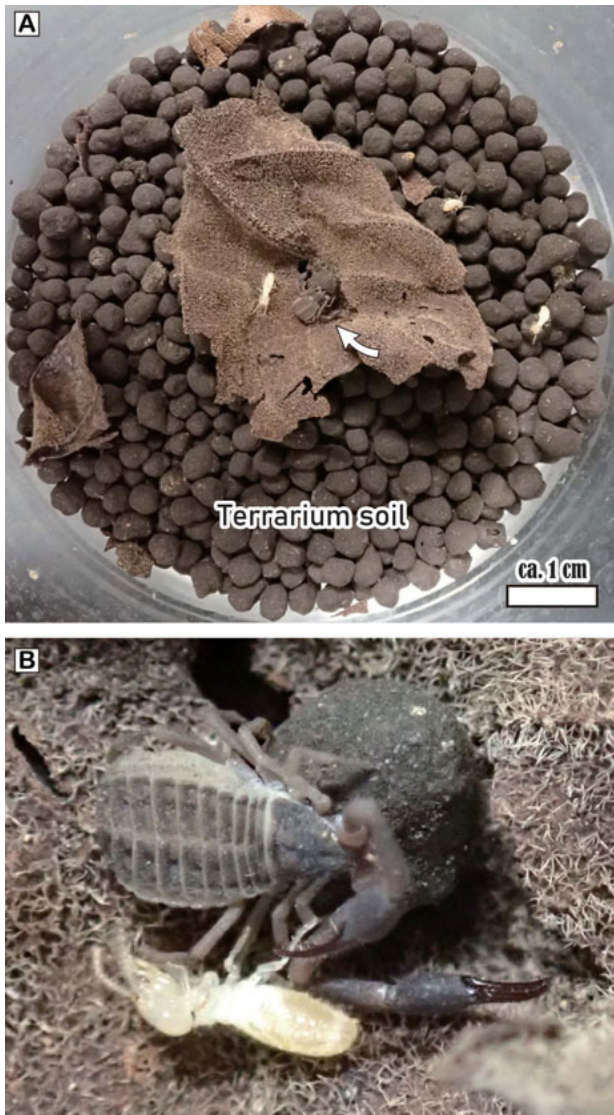
Figure 3. Pseudoscorpion kept in a glass bottle. A, General view of a glass bottle for storing the pseudoscorpion. Terrarium soil of a few millimeters thick is paved along the bottom of a glass bottle, and a fragment of a dried leaf was placed on the terrarium soil. The pseudoscorpion is normally under a dried leaf in such keeping environment. For the photo, the pseudoscorpion was placed onto a dried leaf intentionally. A few termites ( Reticulitermes speratus ) were added as living prey for the pseudoscorpion; B, failed attempt by the pseudoscorpion to catch a termite, which moved away.

ち帰って後、写真を基に第二著者により雌と判断された (Fig. 2E)。その後、第一著者はガラス瓶 (底面直径 7 cm, 高さ 8 cm) 内にテラリウムソイルを数 mm の厚さに敷き詰め、枯れ葉を一枚入れた状態で、生餌としてヤマトシロアリ Reticulitermes speratus を与えて概ね乾燥状態で飼育していた (Fig. 3)。2021 年 1 月 26 日の生息確認を最後に、1 月 28 日に死亡を確認し、飼育日数は 150 日間であった。1 月 29 日、個体の写真撮影と計測をデジタルマイクロスコープ (VHX-