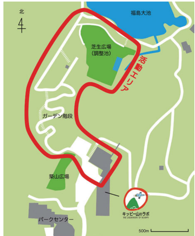
図1 「あさムシ！」の活動エリア。

れた虫をユニパックに入れ、種名を付箋に書いて掲示したが、付箋には種名だけではなく個体数等も併記しておき、プログラム終了後に回収、調査データとして記録した。なお今回記録された生物は壁に貼られた個体のみであり、プログラム中に目撃したが途中で逃げられた、採集したが壁に展示しなかった等の個体は記録から除外した。