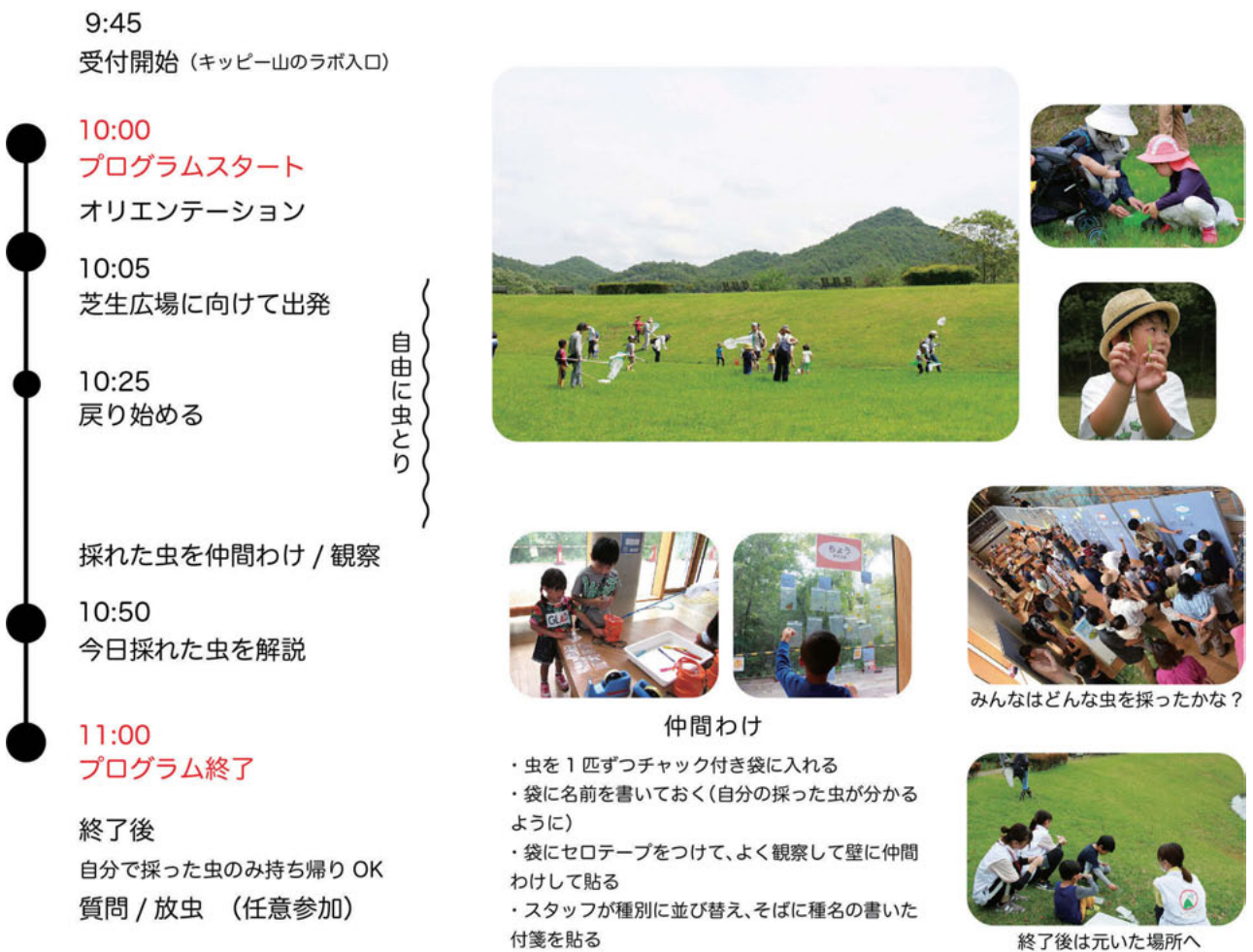
図2 ワークショップ実施の流れ なお図中の写真の肖像権については、あらかじめ参加者より承諾を得ていることをここに付記しておく。

ほか、2019）。今回、「あさムシ！」で確認された生物は318種で、その内昆虫類は292種であった。種数の数字だけに着目すると、子ども向けプログラムを3年間実施しても、昆虫相調査経験のある大人が1年間調査した成果には遠く及ばない結果である。しかし、採集された種について比較したところ、「あさムシ！」で採集された昆虫292種の内48種（約16%）は2018年の調査では未確認の種であった。この要因として①調査員の違い、②調査期間の違いが考えられる。①について、「あさムシ！」ではプログラムの特性上、不特定多数の参加者が様々な視点で昆虫を探し、集めてくる。この参加者集団が言わば調査員であり、たしかに技術的な面においては、大人の昆虫の専門家が行う採集に劣る。だが、虫とり習熟度が低いことでむしろ満遍なく調査できた可能性が考えられる。②の調査期間の違いについて、ワンシーズンでのみの定点調査の場合、調査日のコンディション次第でその季節の虫のデータが左右される可能性が高い。しかし「あさムシ！」はプログラム化することで、数年間ではあるものの継続的に実施することができた。また、繰り返しになるがプログラムの特性上、「あさム