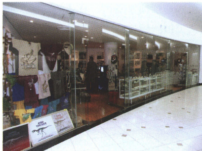
写真2 ガラス張りによる空間の連続性が感じられる石川県立恐竜博物館