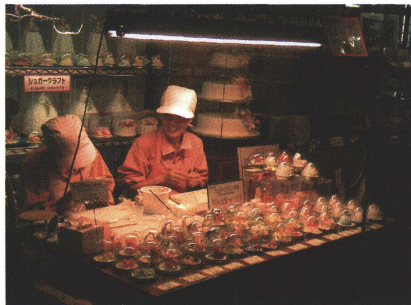
写真1 職員が働いているところをそのまま来館者にみせているチョコレートファクトリー

その他、レファレンスルームを強化し図書館を設置するとともに、本館と収蔵庫に囲われた深田公園では、地学系収蔵庫とレールで繋がれた、調査済の鉱物が入ったトロッコが設置される。子ども達はそこで宝物を探すかのように、鉱物を手にとって遊ぶ活動を誘発し、遊びながら学習できる環境の場を設える。