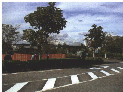
写真5 子供の誕生を記念して作られた封入標本で出来る「THE GREAT WALL」