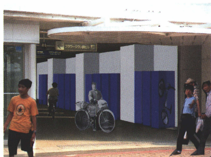
写真6 フラワータウン駅に設置された折りたたみ自転車を入れる自転車ボックス