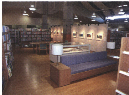
写真3 図書館・絵画展・学習室などを一つの景として捉える能登川町立博物館