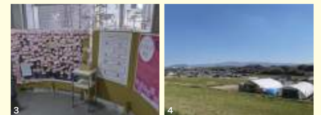
1. フラワータウンの景観 2. 買い物客とまちの今後について自由に対話する「まちかど談話」 3. フラワータウン市民センターに設置した「まちかど伝言板」 4. 農村地域と隣接するフラワータウン

た。大切なのは、フラワータウンの多様な価値や資源を発見し、それらを共有し、地域づくりに活かしていくことです。ひとはくは、「ここで生まれ育った人が帰ってきたくなるまち」、つまり「ふるさと」としてのフラワータウンをつくることに貢献していきます。