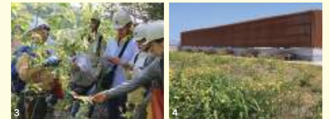
1. 大阪ガス(株)姫路製造所における西播磨地域産の多様な植物を育む緑地 2. ミツカンよかわバイオトープでの地域と連携した環境学習の取り組み 3. 竹中工務店における生物多様性研修の様子 4. エスペック(株)神戸R&Dセンター新社屋上での地域性種苗による緑化

の生物多様性促進プログラムにおける社員研修の企画・運営や研修所敷地内での里山保全の支援、エスペック(株)神戸R&Dセンター新社屋における地域性種苗を用いた生物多様性に配慮した屋上緑化への種苗提供および技術的支援などがあります。