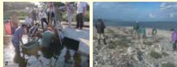
1. ブイブイの森における里山担い手養成講座の実施 2. 武庫川における小さな自然再生の取り組み 3. 淡路島におけるハマアザミの保全

様々な団体との連携の促進に取り組んでいます。また但馬地域での絶滅危惧植物の保全活動の支援として、それらの種子保存や植物の栽培・増殖を実施しています。このほか、兵庫県植物誌研究会の淡路島でのハマアザミの保全、多紀連山のクリンソウを守る会の篠山でのクリンソウの保全などに対して、モニタリングやデータ解析の協力を行っています。