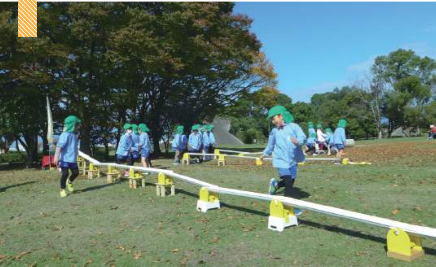
「しぜんえんそく」でどんぐりを転がして遊ぶ子どもたち