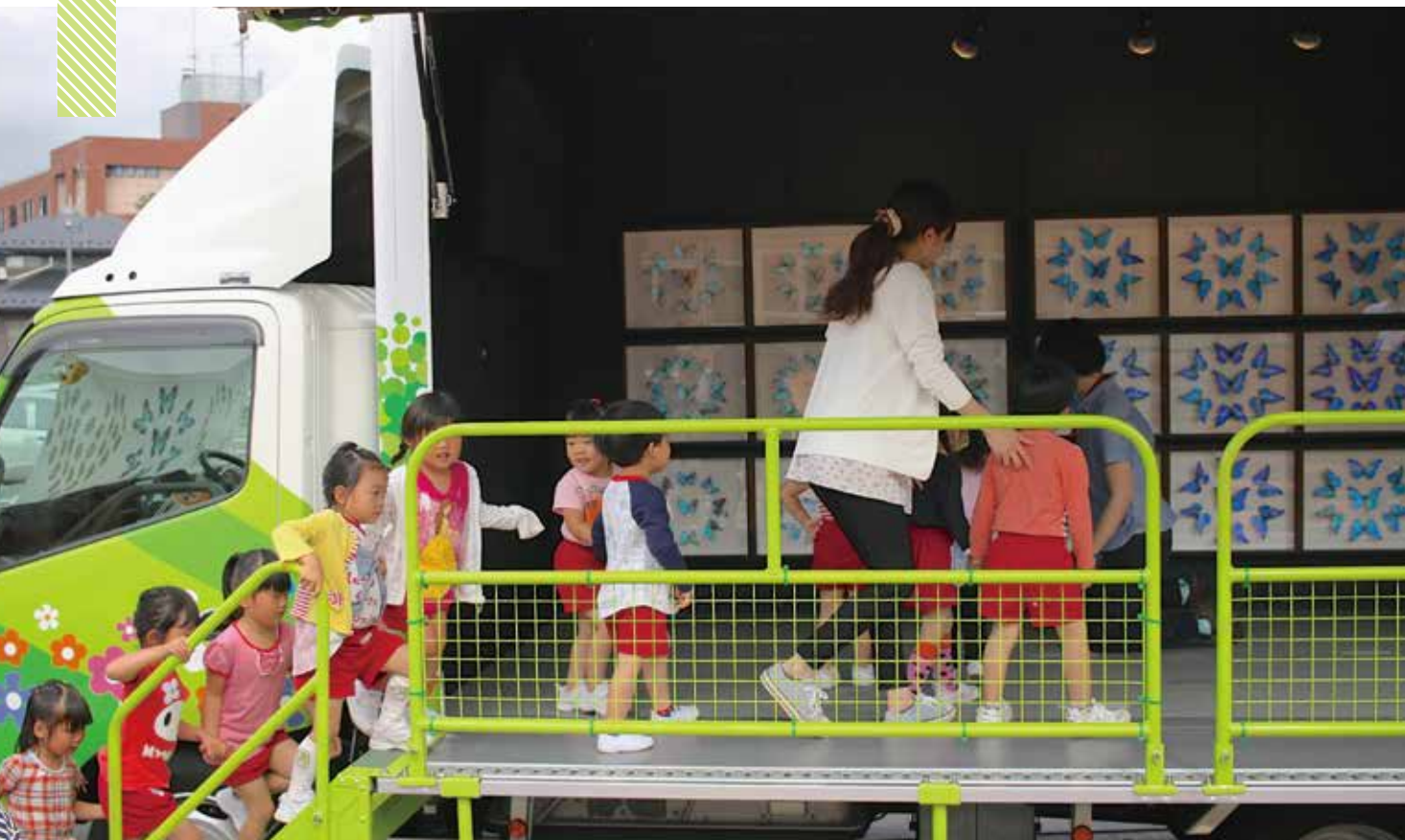
車内が展示室になる。棚倉町立棚倉幼稚園