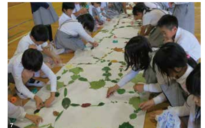
1.開館20周年記念行事での「ゆめはく」のお披露目 2.貨物船で家島へ向かう 3.「はたらくるま大集合」への出展(東条湖おもちゃ王国) 4.「ゆめはく」車内での標本観察(高砂市立荒井小学校) 5.恐竜化石レプリカや大型昆虫模型で体験への動機付け(三木市立志染保育所、篠山市立たぎ幼稚園) 7.小学2年生と「葉っぱコネクト」~「ゆめはく」での展示見学だけでなく体験型プログラムをあわせて実施することが多い(大阪市立榎本小学校)