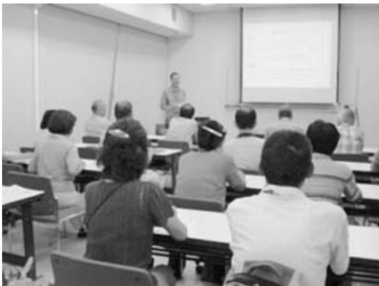
写真5. セミナー風景