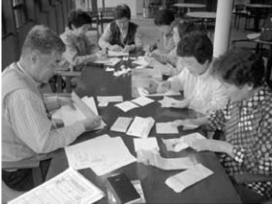
写真1. タネの分封作業