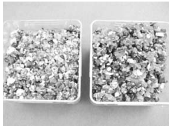
写真6. シダの胞子播き