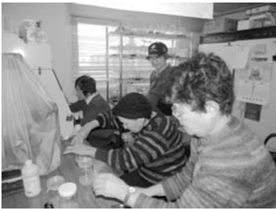
写真3. 無菌培養実習