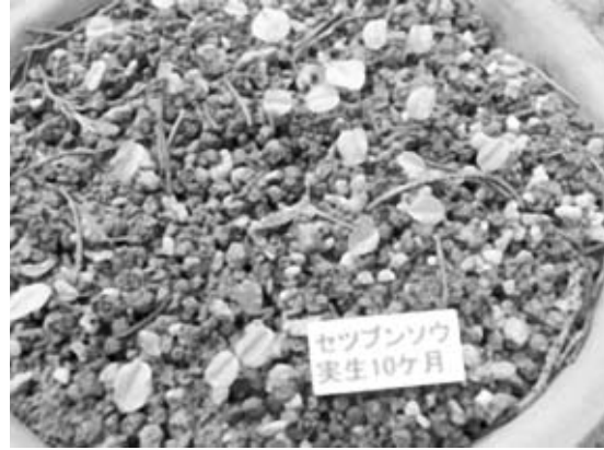
写真2. セツブンソウ実生増殖