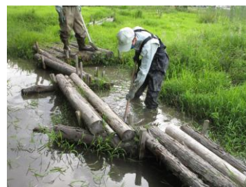
図3 ビオトープの整備

ビオトープは、水深の浅い場所や深い場所、湿地などいろいろな環境をつくることで、多様な生物がすめることを期待している。そのため、泥上げや草引きなどの整備を行い、環境の維持に努めている。また、生物の観察をしやすくするため、杉の間伐材や倒木を利用した栈橋を設置している(図3)。