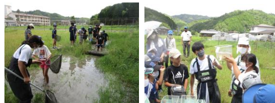
図4 生き物観察会(たんば子ども塾)

8月10日に丹波青少年本部主催「たんば子ども塾」において丹波地区の小学生約30名を対象に観察会を行った(図4)。参加者全員でビオトープの生き物を採集し、水槽やバットに種類ごとに分類して観察できるようにした。それを私たちが生態や特徴などの解説をした。