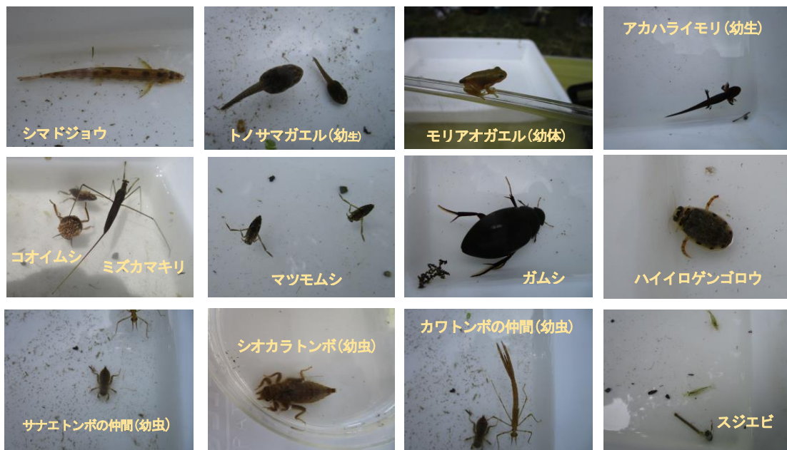
図 5 ビオトープの生物(一部)

使って観察会をすることによって、生き物と触れ合うことができました。また、ビオトープによって地域で数を減らしている生物の生息場所を確保することも期待できる。今年の夏休み中に生物の生息調査を行い、両生類 5 種、魚類 2 種、昆虫類 13 種、甲殻類 2 種、その他 2 種を確認した(図 5)。人がいないときには、サギがカエルや魚などを食べに飛来することも確認している。ちなみに今までに確認している生物は約 40 種の記録がある(表 1)。