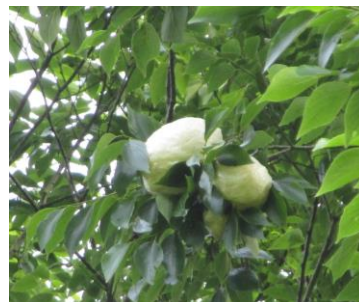
図2 モリアオガエル(卵塊)

このビオトープは里山に隣接しているため、絶滅危惧種であるモリアオガエル(図2)やシュレーゲルアオガエルが産卵し、ドジョウやスジエビ、アカハライモリ、水生昆虫など多く生息するようになった。そこで、私たちは小学生を招いて生き物観察会を行い、田んぼ(ビオトープ)の生き物について紹介して地域の環境の大切さを広げる活動をしている。