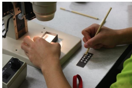
火山灰に含まれる鉱物標本の作製