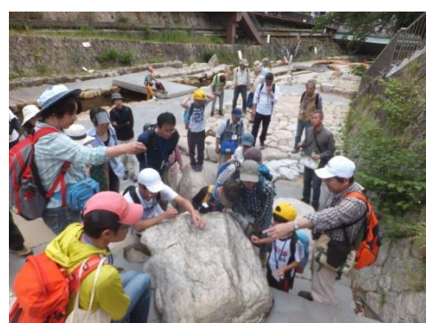
有馬温泉 親水公園で花崗岩観察