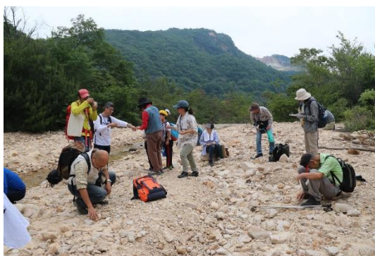
蓬莱峡 太多田川で花崗岩採取観察

蓬莱峡を巡り、太多田川の砂防堰堤について学び、太多田川沿いの花崗岩を採取観察しました。次に有馬温泉へと移動し、泉源や虫地獄などを巡りました。途中、炭酸泉源では試飲をするなど有馬温泉を満喫しました。