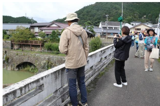
銀の馬車道を橋から観察