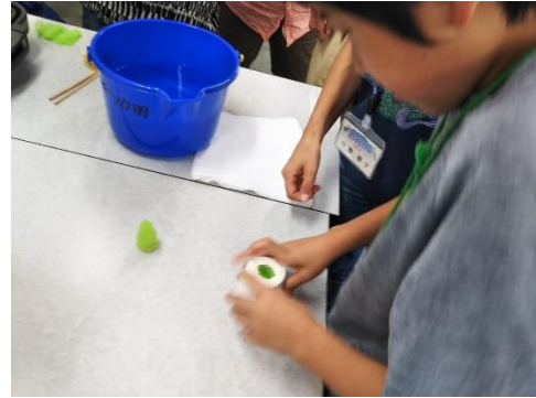
おゆまるで放散虫化石の 拡大模型レプリカ製作