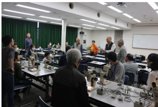
火山灰の観察要領の説明

火山灰のサンプルから実体顕微鏡を用いて、石英、長石、雲母などの鉱物を観察しました。また、これらの鉱物を採取しプレパラートを作り、火山灰の標本としました。