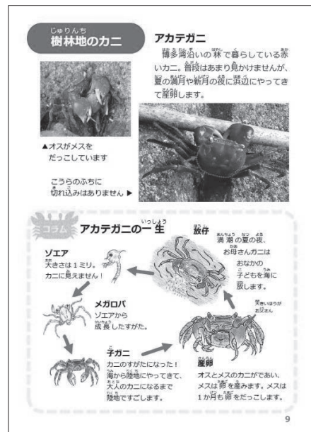
図3. アカテガニ (「博多湾のカニずかん～海岸で見られるカニたち～」から引用)