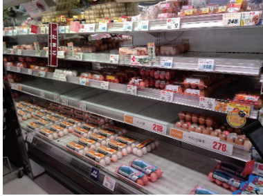
① 売り場の写真をとる。