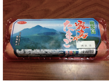
② パッケージの写真をとる。