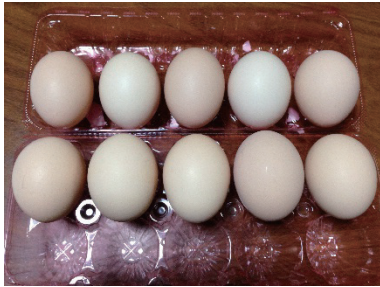
③ たまごの写真をとる。