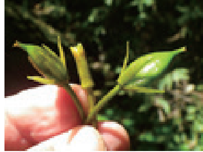
写真4 アサザの果実