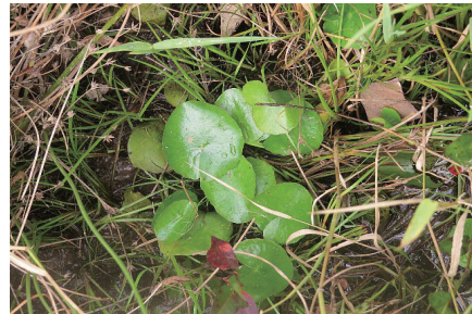
写真6 アサザの実生苗

アサザは、短花柱花どうして種子ができることは確認できた。そこで、ため池で種子が発芽成長しているのか実生苗を探したところ、砂州の水と陸地の移行帯で実生苗が確認できた。