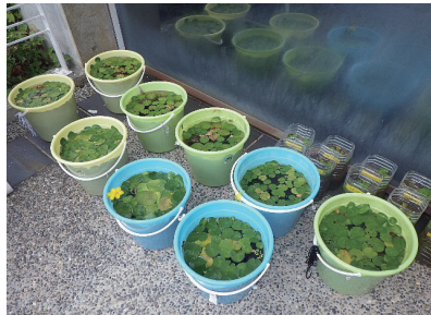
写真5 交配実験用アサザ