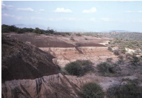
写真2 直立原人とボイセイ猿人の化石が発見されたKGA10の地層 黒い粘土層の下の赤茶けた砂礫、砂、泥の互層から2種の古人類化石が発見された。互層の下位には再び、暗灰色の粘土層が堆積している。

KGA10 と名付けた調査区では、黒色や暗灰色の粘土層に挟まれた赤茶けた砂礫、砂、泥の互層から、直立原人 ( Homo erectus ) だけでなく、ボイセイ猿人 ( Australopithecus boisei ) に属する別種の古人類の化石が発見されました(写真3)。これらの古人類化石の産出層の直下にはピンク色の細粒火山灰 (Lehayte 火山灰) が挟まれ、上位には灰色の粗粒火山灰 (Karat 火山灰) が見つかりました。Lehayte 火山灰の直下には、灰色～暗灰色の粗粒