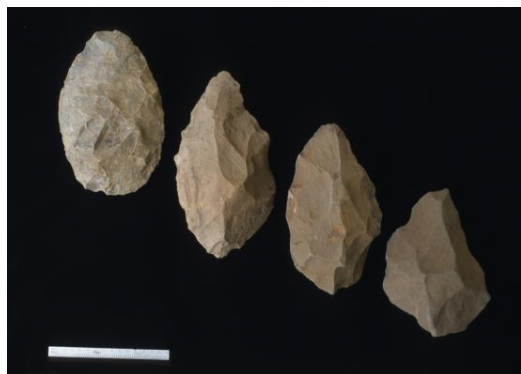
写真4 コンソ層から産出した約 175～85 万年前の手斧石器

右下から左上に、約 175 万年前、約 160 万年前、約 125 万年前、約 85 万年前の手斧石器を示す。スケール長は 15 cm。