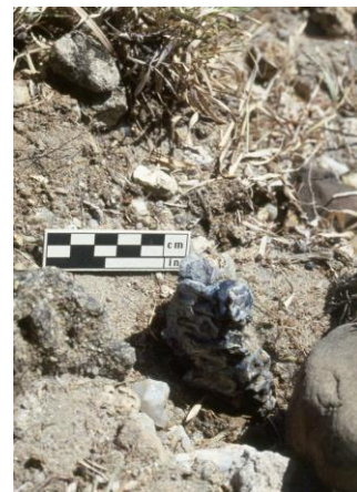
写真3 KGA10 で発見されたボイセイ猿人の上顎化石