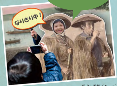
顔出し看板イメージ