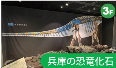
兵庫の恐竜化石 県内で発見されたタンパティタニスやヤマトサウルスなどの恐竜化石をはじめ、各地域から産出する代表的な動植物化石について、その研究成果を紹介しています。