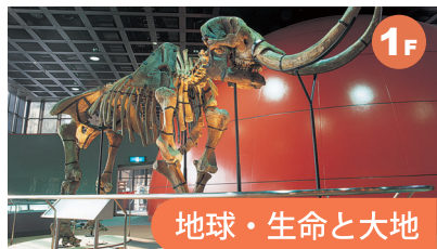
地球・生命と大地 約40億年前の生命誕生から人類誕生までの生物の歴史を、多くの化石標本でたどっています。また、森林の多様性、地球のプレート運動、日本列島の生い立ちを紹介しています。