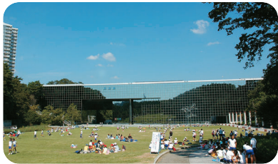
▲博物館のすぐ隣には、広大な芝生広場（深田公園）があり、開放的なオープンスペースとなっています。

1階～3階が「常設展示」、4階には触れる標本や図書コーナー、休憩コーナーがあります。