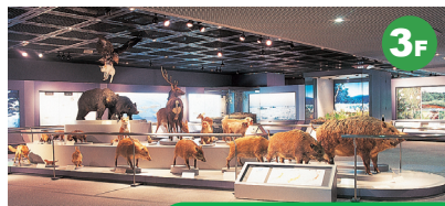
兵庫の自然誌 南北とも海に接し、気候の変化が大きい兵庫県の特徴ある自然を大型パネル・映像・ジオラマなどで紹介しています。「森に生きる」では兵庫県で見られる野生動物をはく製で紹介しています。