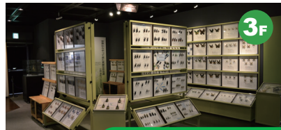
ナチュラリストの幻郷 博物館に寄せられた多数のコレクションを見て、ナチュラリスト達がどのような思いで何を夢見て収集してきたのかを感じ取ってください。