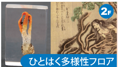
ひとはく多様性フロア 期間限定で実施する企画展示を開催するフロアです。その時の最新の研究内容を盛り込んだ展示を楽しむことができます。