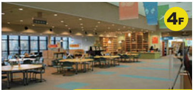
ひとはくサロン 自由に閲覧できる「図書コーナー」や、自然環境についての最新の情報が集められている「情報コーナー」のほか、「休憩コーナー」などがあります。ワークショップやイベントが開催されます。