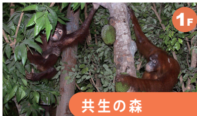
共生の森 ラフレシアやオランウータンなど、赤道直下のボルネオ島の貴重な標本類を展示しています。熱帯雨林を体感しながら「共生の森」について学ぶことができます。