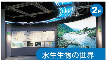
水生生物の世界 ナガスクジラの骨格標本やアオザメのはく製といった海に棲む大型の生物を展示しています。また、河川における淡水魚の分布と生活を例にあげて生態系のしくみを解説しています。