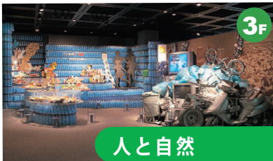
人と自然 “モノ”と“ゴミ”が、豊かな暮らしのあり方や環境問題を問いかねます。動植物のすみかでもある自然と人のつきあい方を考えた新しいまちづくりと生活スタイルを提案しています。