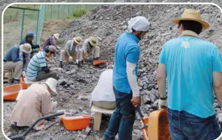
※ 写真は県立丹波並木道中央公園で実施したものです。