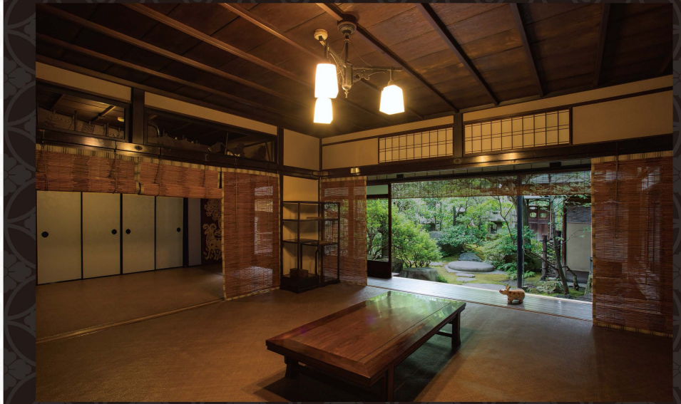
花洛庵は、伏見奉行の小堀遠州屋敷を移築した建物で、江戸時代の町家の面影を今に伝える「野口家住宅」として、京都市の有形文化財に指定されています。