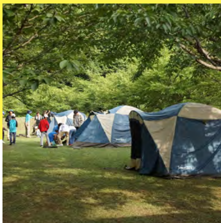
篠山層群の真上でキャンプ

篠山層群の上にある公園で「ツリーイング」を体験。器具を使って自分の力だけで樹を登るぞ。