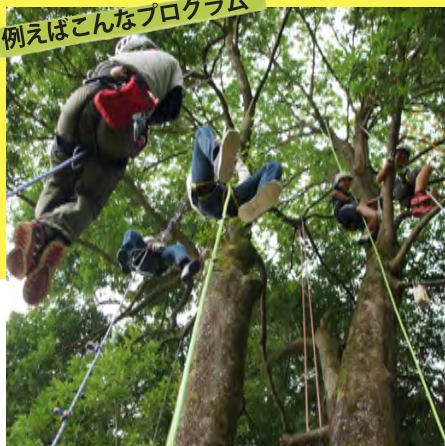
恐竜の背の高さまで樹を登る

篠山層群の上にある公園で「ツリーイング」を体験。器具を使って自分の力だけで樹を登るぞ。