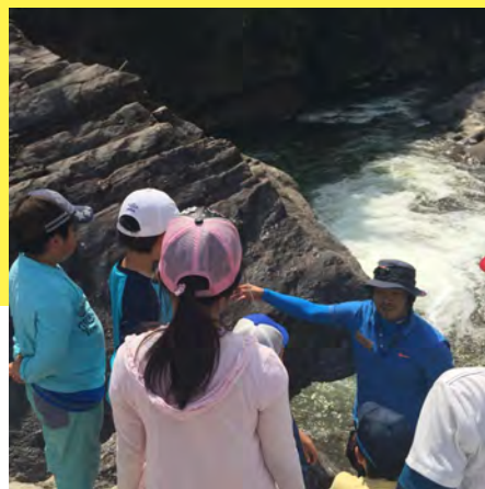
丹波竜発見地・特別見学

キャンプ宿営地は、恐竜化石の見つかった篠山層群の真上だ。1億1千万年前に思いをはせて眠りにつこう。