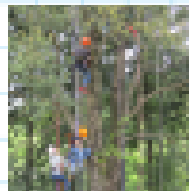
樹の上から景色を一望！ ツリーイング体験