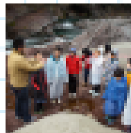
恐竜が発見されている 地層を見学・石割体験も！