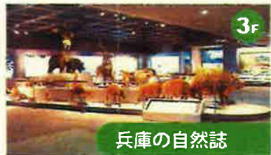
兵庫の自然誌 南北とも海に接し、気候の変化が大きい兵庫県の特徴ある自然を大型パネル・映像・ジオラマなどで紹介しています。「森に生きる」では兵庫県で見られる野生動物をはく製で紹介しています。