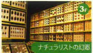
ナチュラリストの幻郷 博物館に寄せられた多数のコレクションについて、標本を見てその意味を知り、ナチュラリスト達がどのような思いで何を夢見て収集してきたのかを感じ取ってください。