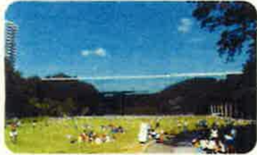
▲博物館のすぐ隣には、広大な芝生広場(深田公園)があり、開放的なオープンスペースとなっています。