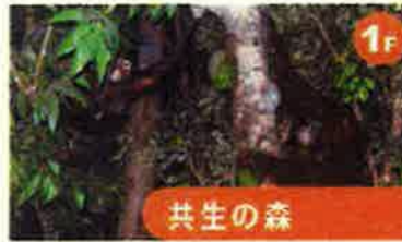
共生の森 ラフレシアやオランウータンなど、赤道直下のホルネオ鳥の貴重な標本類を展示しています。熱帯雨林を体感しながら「共生の森」について学ぶことができます。