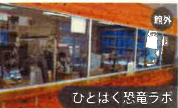
ひとはく恐竜ラボ 恐竜化石のクリーニング作業及び展示等を行う施設として「ひとはく恐竜ラボ」が2008年4月にオープンしました。研究員などによる作業風景を間近に見ることが出来ます。