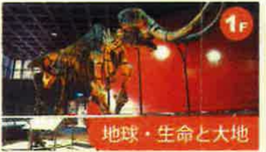
地球・生命と大地 約35億年前の生命誕生から人類誕生までの生物の歴史を、多くの化石標本でたどっています。また、河川における淡水魚の分布と生活を例にあげて生態系のしくみを解説しています。