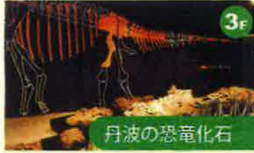
丹波の恐竜化石 丹波市山南町で発見されたタンパティタニス・アミキティアエの化石や、同時に発見された他の恐竜の歯、小動物の化石なども展示しています。