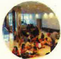
▲ホワイエ2、3Fは団体の雨天時昼食場所としてご利用いただけます。(要予約)