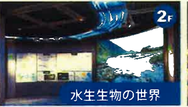
水生生物の世界 ナガスクジラの骨格標本やアオザメのはく製といった海に暮らす大型の生物を展示しています。また、河川における淡水魚の分布と生活を例にあげて生態系のしくみを解説しています。