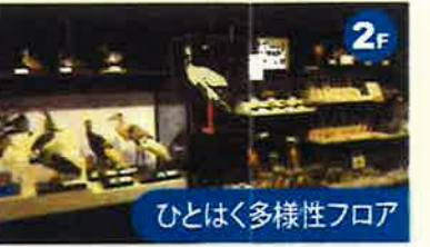
ひとはく多様性フロア 2012年10月に、開館20周年を記念し新たにオープンしました。本物の標本や資料にふれることができ、研究員などによる演説や期間限定の展示もおこなわれています。

傘、ラケット、ボールなどは館内に持ち込めません。 手荷物は無料ロッカーをご利用ください。 館内での飲食・喫煙はご遠慮ください。 ※4階ひとはくサロンの休憩コーナーは飲食可能です。飲料自動販売機も設置しています。 喫煙は、3階入口外とエントランスホール外に灰皿を設置しています。