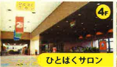
ひとはくサロン 自由に閲覧できる「図書コーナー」や、自然環境についての最新の情報が集められている「情報コーナー」のほか、「休憩コーナー」などがあります。ワークショップやイベントが開催されます。