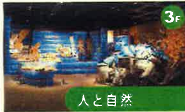
人と自然 "モノ"と"コミ"が、豊かに暮らしのあり方や環境問題を問いかけます。動植物のすみかでもある自然と人とのつきあい方を考えた新しいまちづくりと生活スタイルを提案しています。