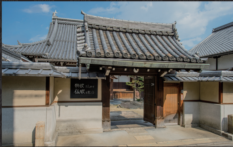
龍岸寺は浄土宗の寺院で、元和2年(1616に、僧 三哲(安井算哲/源連社長譽三哲和尚)により開かれました。安井算哲は、江戸幕府初代天文方となった渋川春海の父親でした。春海自身も、晩年江戸に移住するまでは龍岸寺にあった屋敷に住んでいました。