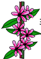
ミソハギ (ミソハギ科) 茎の上部のイメージ