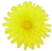
上からみた ブタナの花