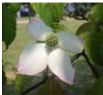
ヤマボウシ(ミズキ科)の白い苞