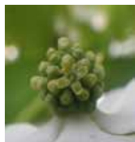
ヤマボウシの花が1つだけ咲いているところ(5月下旬)

5月の下旬頃から、ヤマボウシの花が咲き始めます。しかし、皆さんが花びらと思って見ている白いものは、花びらではありません。苞(ほう)と呼ばれるものです。では、本当(?)の花は、どこにあるのでしょうか? じつは、白い苞の4枚が合わさった中心部分に、緑色の花びら4枚をもつ小さな花がたくさん集まってあるのです。