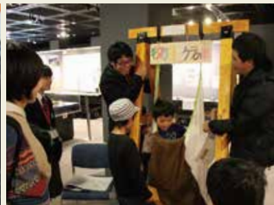
なんと、トビケラの巣を体験できるブースも現れました。