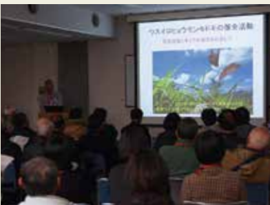
口頭発表に集まるオーディエンスは100名近く。