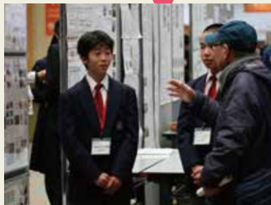
先輩方からのアドバイス！いただく感想、意見は宝物ですね。