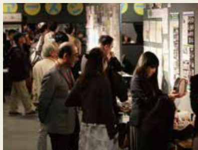
初参加者もベテランも。興味深い発表に話の花が咲きます。