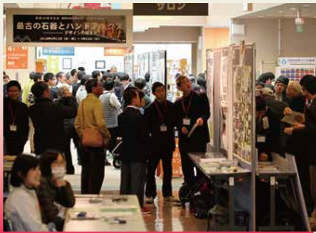
館内は大賑わい。展示も1日限りです。前回は77点のポスター発表、8点の口頭発表がありました。