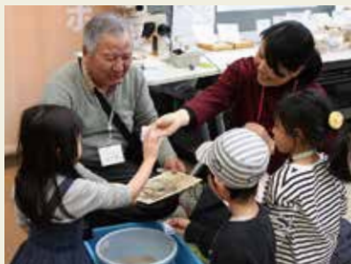
砂から砂鉄を集めるコーナー。もちろん子ども達に大人気。