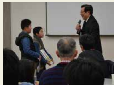
優れた発表は賞が贈られます。講評もありますよ。

生き物好き、化石好き、アーティスト、様々な場所で様々な活動しておられるみなさんの発表が勢ぞろいする1日です。懐かしい同志との再会あり、新たな有志との出会いもあり。今年もそれぞれの想いを持って発表に参加して下さる皆さんを、ひとはく館員一同、心よりお待ちしております！！