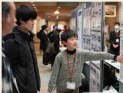
小学生も市民学会デビュー！丁寧に解説してくれました。