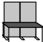
ボード 2枚 + 机 1台