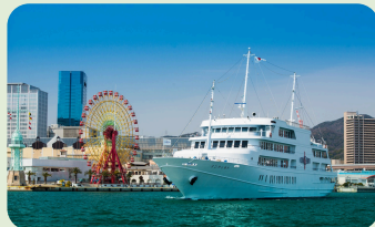
THE KOBE CRUISE コンチェルト (神戸市) 大人ペア割引優待券