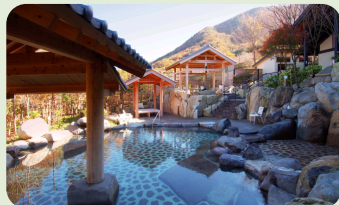
こんだ薬師温泉ぬくもりの郷 (丹波篠山市) 大人ペア入浴券