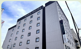
KOKO HOTEL 姫路城 (姫路市) 大人ペア宿泊券