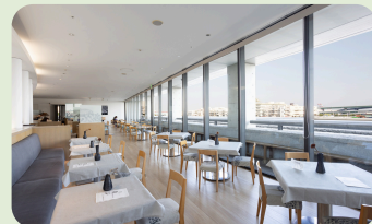
Restaurant Rokumei saryu (神戸市) 食事券(2000円分)