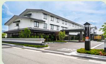
グランヴィリオホテル丹波篠山-和蔵- (丹波篠山市) 大人ペア宿泊券