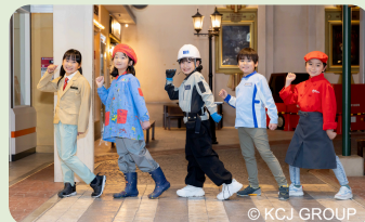
キッズニア甲子園 (西宮市) 子ども・大人ペア無料招待券 ※子ども(3~15歳)と大人(16歳以上) の組み合わせでご入場ください