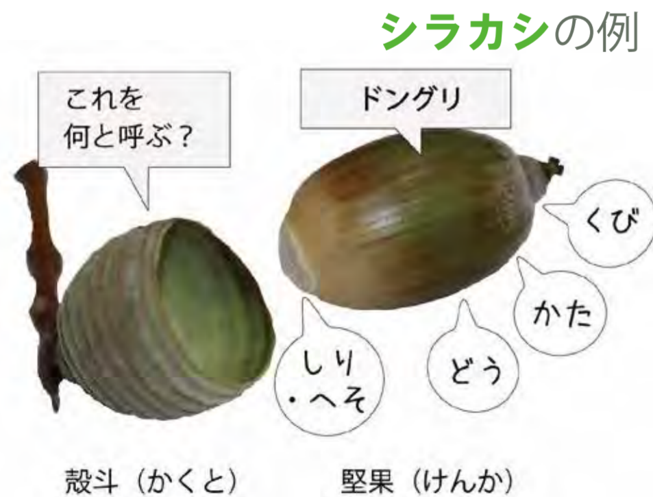
図5 ドングリに関する各部位の名称

かくと 殻斗のことを多くの方が「帽子」と呼んでいるようです（図2～4）。図5のようにドングリの各部を人の身体の名称にして呼ぶことがあります。その場合、 かくと 殻斗とくっついていてる部分は「しり・へそ」と言います。それらを隠すものは、「帽子」でしょうか？小さな子どもに聞くと「パンツ」と答えてくれたりします。私は、「帽子と呼ばないで運動をしています」と言いながら、ドングリの話を始めるとにしています。ちなみに、年配者は「はかま」と呼んでいる人が複数みられました。あなたは、何と呼びますか？