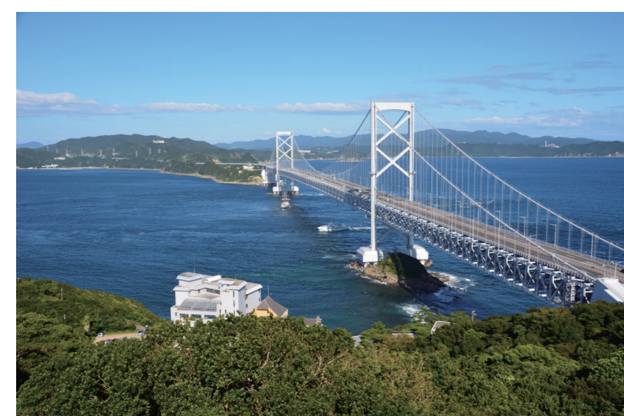
鳴門山展望台（鳴門市）からの眺望景観

鳴門海峡の眺め（眺望景観）は、日本を代表する景観として「日本八景（1927年）」に選ばれるなど古くから親しまれています。この眺望景観を保護するためには、眺望地点から遠い山並などが、どの範囲まで眺められるのかを調べる必要があります。