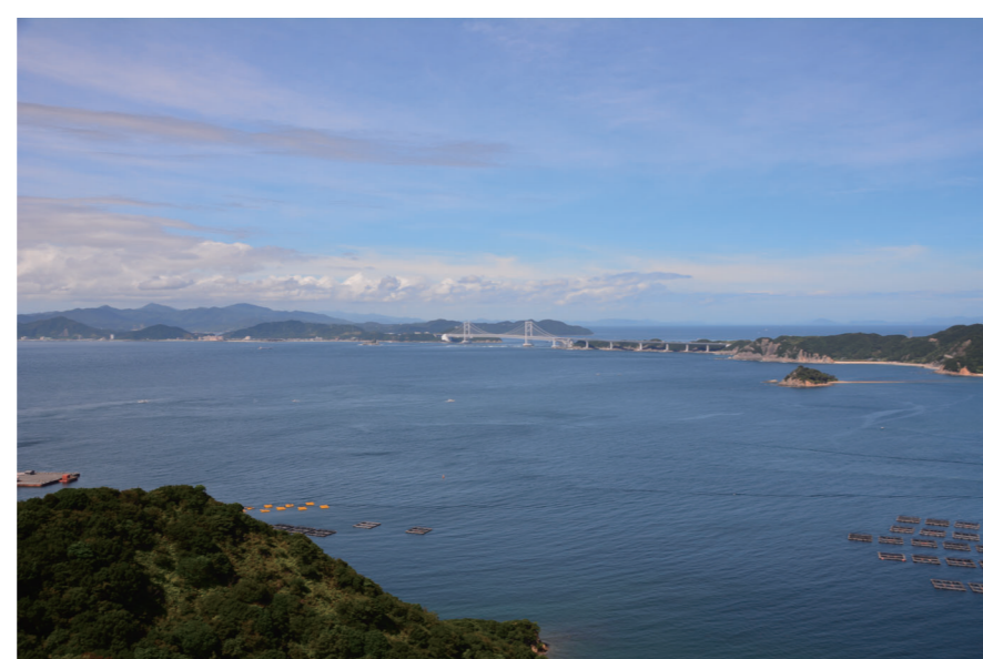
若人の広場（南あわじ市）からの眺望景観