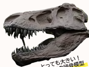
とっても大きい！ ティラノの頭骨模型

主催：兵庫県立人と自然の博物館 共催：香美町小代観光協会 協力：一般社団法人 INCREW、スミノヤゲストハウス、一般社団法人 ROOT