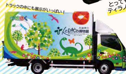
トラックの中にも展示がいっぱい！