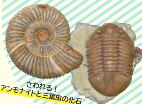
さわれる！ アンモナイトと三葉虫の化石