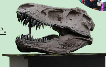
恐竜化石レプリカ

〒669-1546 三田市弥生が丘 6 丁目 兵庫県立人と自然の博物館 アウトリーチ担当：八木 TEL：079-559-2001（代表） http://hitohaku.jp