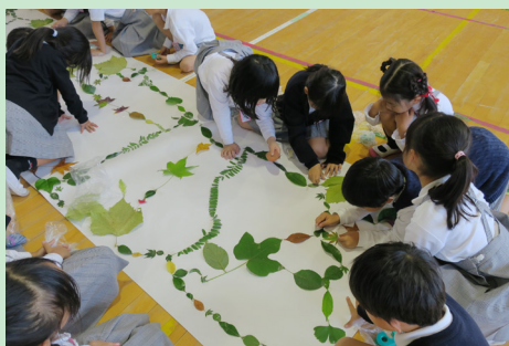
葉っぱコネクト（1、2 年推奨）

実物の生体や標本、レプリカ、模型が、児童の好奇心を引き出し、研究員が、児童の学びを深めます。