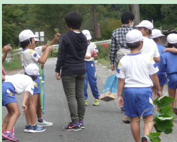
学校や周辺で植物の観察