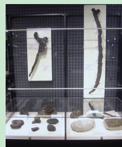
丹波化石レプリカ

用いる資料や授業内容は、ご相談の上、決定します。ここに掲げた例以外にも、さまざまな内容が実施可能です。これまでの事例は、ホームページをごらんください。