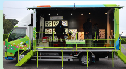
車が展示室に変身するよ (変身には 30 分くらいかかります)