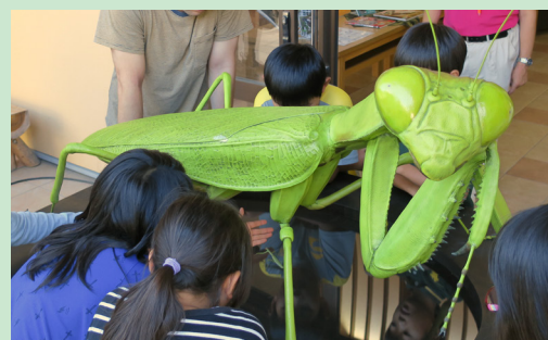
拡大模型：こん虫の観察