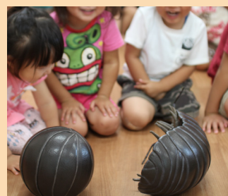
拡大模型 (ダンゴムシ)