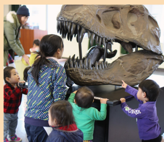
恐竜化石レプリカ