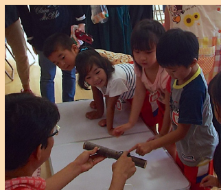
さわれる生きもの