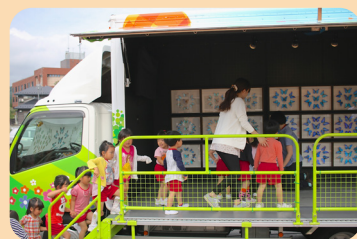
車が展示室に変身するよ (変身には30分くらいかかります)

移動博物館車 ゆめはく 2t車 L6.4×W2.1×H3.3m 展開時(↓)はW5m程度