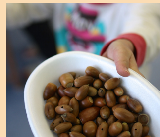
どんぐりがいっぱい

内容は、ご相談の上、決定します。ここに掲げた例以外にも、さまざまな内容が実施可能です。 これまでの事例は、ホームページをごらんください。