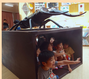
拡大模型 (クワガタ)