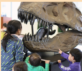
ティラノサウルス頭骨レプリカ