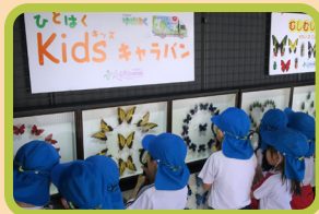
車の中が展示室に変身するよ

人と自然の博物館は、三田市にあります。移動博物館車「ゆめはく」が、さわられる資料、体験メニューといっしょに、みんなの園を訪問します。お遊戯室がミュージアムに！