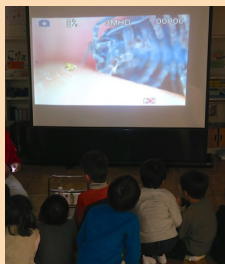
大きくしてみよう

内容は、例です。そのつど決定します。昆虫拡大模型・ティラノサウルス頭骨レプリカは、どちらか一つになります。昆虫拡大模型には、いくつかの種類があります。