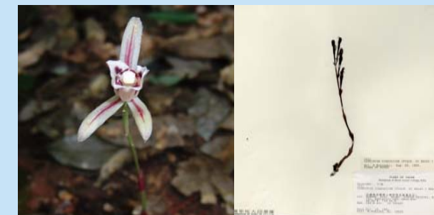
写真1 マヤラン（左：生体 右：実の標本）