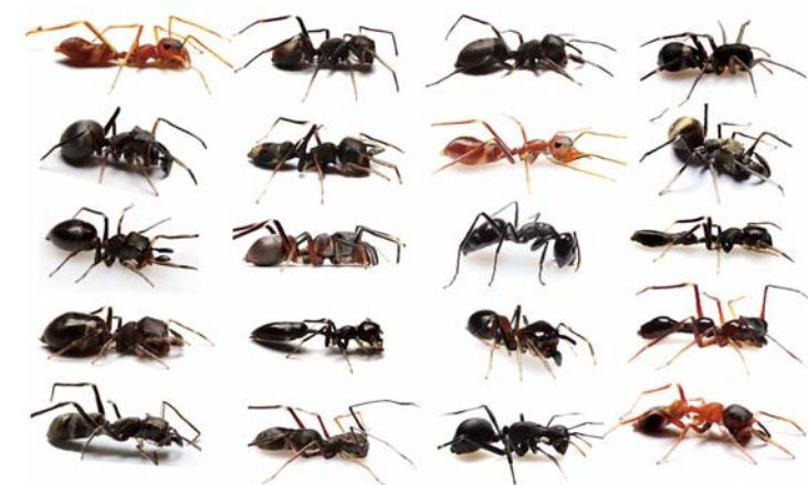
写真1 ボルネオ島のランビルの森で見つけたアリに化けるクモたち。一匹だけアリが混じっていますが、どれか分かりますか？（答えは、4 ページ右下です）