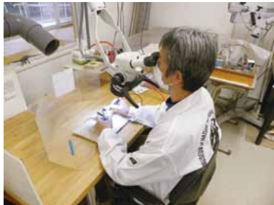
写真1 化石の剖出作業

このたび、動物分類学の専門誌 Zootaxa の第3848号(2014年8月12日発行)において「丹波竜」が竜脚類の新属新種として記載され Tambatitanis amicittiae (タンバティタニス・アミキティアエ) と命名されました。これは発見以来6回にわたって行われた発掘により得られた化石資料の剖出(化石から岩石を除去する作業、クリーニングともい