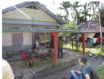
写真3: スマトラ島のコアハウス2

東日本大震災後の復興をはじめ、わが国では現地再建を支援する枠組みが弱い。仮設住宅は被災地とは別のところに建てられることが多く、コミュニティの構成員をシャッフルしてしまい問題が多いと思っている。