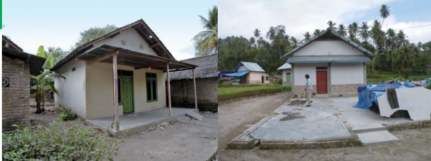
写真1: ジャワ島のコアハウス

出た。22万人の死者を出した津波で記憶に残る2004年12月のパ ندا・アチエ沖地震M9.1とは、別物である。