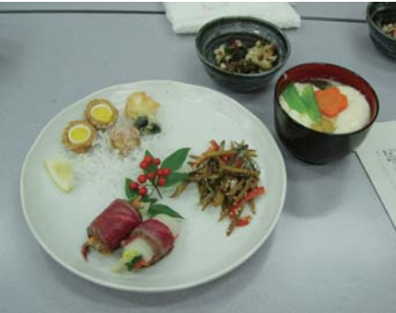
昨年の「簡単料理教室」は三田の素材を用いたおせち料理

高速道路はまた山間部へ入って行きます。ある日、西淡三原ICで高速をおり周辺を探索することにしました。察しのよい人は既にお分かりのことと思いますが、その建物は「玉葱小屋」です。淡路は玉葱産地として有名です。玉葱は稲作の裏作として田んぼで生産されています。よって、田んぼの直ぐ脇に収穫量に見合うだけの玉葱小屋が設置されます。収穫した玉葱が痛まないよう、風通しのよい場所に干し保存し、市場価格の動向をみながら出荷のタイミングを図るのだそうです。玉葱に十分な風を当てるために余分な壁面がないことが、建築構造を表出させています。私はこのシンプルな造形と機能美に甚く感心しています。文化財保護法が改正され、地域における人々の生活又は生業および当該地域の風