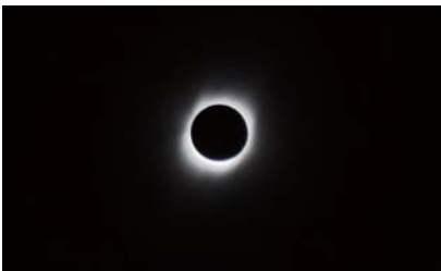
皆既日食中の太陽