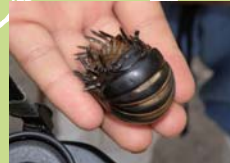
ゴルフボール大の巨大なタマヤスデ