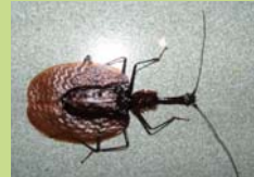
楽器の形にそっくりなバイオリンムシ

8月4日には、抱えきれないほどの思い出と体験を胸に、全員無事に帰国しました。次回、この興奮を味わうのは、この記事を見ている君たちです!!