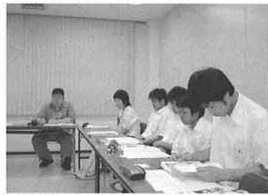
地域実行委員会のようす (上郡町)