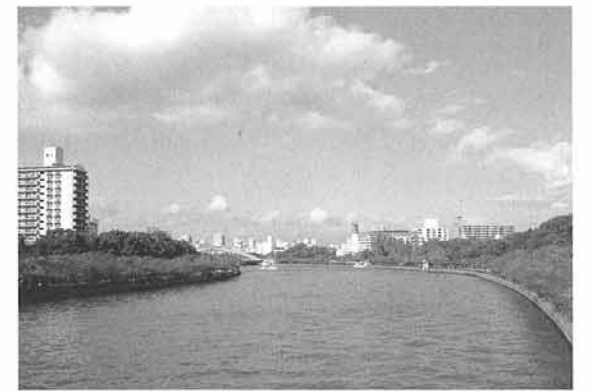
大阪の中之島の東から眺める大川。都市の中に水と緑の景観が広がっています。

みなさんは「都市」と聞くとどのようなイメージを描かれますか。多くの人々が行き交い、大きな建物が立ち並び、交通量も多いといった具合に、なかなか自然の要素である緑や水を思い浮かべることがないかもしれません。しかし、諸説があるものの、都市の起源は川の周辺に人々が生活の利便を求めてともに集まって住み始めたところにあるという説もあり、実は都市の中にもよく見れば自然の要素はあります。東京では、皇居や明治神宮などの比較的大きな緑地が中心地にありますし、大阪でも大阪城公園、中之島界隈に比較的多くの水と緑があります。また、地図には載らない水や緑もあります。大阪ではずいぶん埋め立てられたり、暗渠化(ふたをされること)されたりして、あまり目立ちませんが水路も数多く残されています。さらに、住宅地に入れば数多くの庭木や盆栽が道路際などに植えられているのを見つけることができます。最近では「屋上緑化」といって、ビルなどの屋上に芝などの植栽をする事例も増えてきています。このようによく見ると都市の中にも自然の要素があり、それらをうまくつなげることができれば、都市の中にいわば「自然の道」を作ることができます。