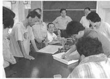
封入標本づくりに取り組む先生たち (加古川市)