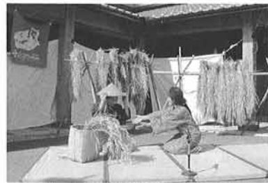
多可高校 激田四季による寸劇 「日本昔話」(西脇市)

2年目となるキャラバン事業「ひとはくがやってくる」は、今年も県下10地域で展開しました。昨年度と同様、それぞれの地域で地元の方々と地域実行委員会を立ち上げ、展示、セミナーなどを企画・運営しました。昨年の様子をご覧になった方や、ホームページを見た方から、「今年は私達の地域に来て欲しい」というリクエストを受けて行かせていただいたところも多くなりました。以下の表は今年度の一覧です。年度途中で依頼があり急遽キャラバンすることになったところもあり、地域によっては2カ所以上になるところもあります。参加者総数は80,000人を越えました。 今年度の大きな特徴は学校との連携を積極的に行ったことです。多くの地域で学校の先生に地域実行委員会に参画していただきました。加古川市の養田公会堂では、近隣の若宮小学校で事前研修を受けられた先生と一しょに封入標本づくりを実施、上郡町では、県立上郡高校農業クラブの学生が先生と一しょに地域実行委員会で企画から関わり、展示物も一しょにつくりました。豊岡市立コウノトリ文化館では、近くにある三江小学校へ出張展示、西脇市の北はりま田園空間博物館では、県立多可高校生が、総合学習の時間に「ハチの竹筒調査」を実施した他、キャラバン会場で寸劇を披露するなど大活躍でした。