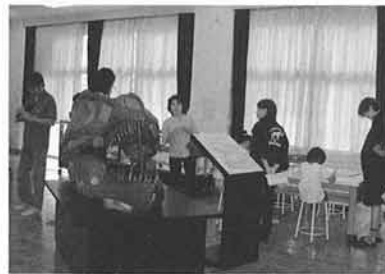
三江小学校での展示風景 (豊岡市)

2年目となるキャラバン事業「ひとはくがやってくる」は、今年も県下10地域で展開しました。昨年度と同様、それぞれの地域で地元の方々と地域実行委員会を立ち上げ、展示、セミナーなどを企画・運営しました。昨年の様子をご覧になった方や、ホームページを見た方から、「今年は私達の地域に来て欲しい」というリクエストを受けて行かせていただいたところも多くなりました。以下の表は今年度の一覧です。年度途中で依頼があり急遽キャラバンすることになったところもあり、地域によっては2カ所以上になるところもあります。参加者総数は80,000人を越えました。 今年度の大きな特徴は学校との連携を積極的に行ったことです。多くの地域で学校の先生に地域実行委員会に参画していただきました。加古川市の養田公会堂では、近隣の若宮小学校で事前研修を受けられた先生と一しょに封入標本づくりを実施、上郡町では、県立上郡高校農業クラブの学生が先生と一しょに地域実行委員会で企画から関わり、展示物も一しょにつくりました。豊岡市立コウノトリ文化館では、近くにある三江小学校へ出張展示、西脇市の北はりま田園空間博物館では、県立多可高校生が、総合学習の時間に「ハチの竹筒調査」を実施した他、キャラバン会場で寸劇を披露するなど大活躍でした。