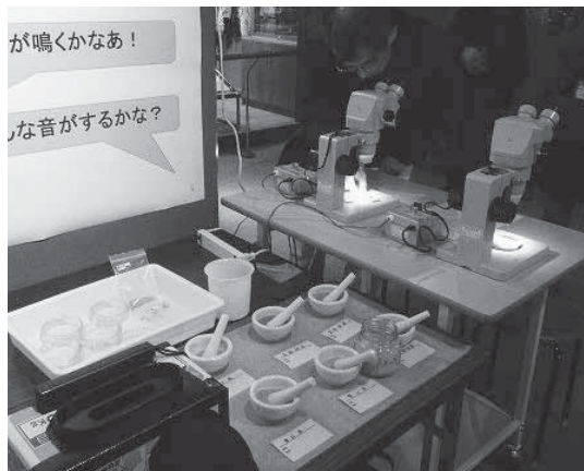
山陰海岸の鳴き砂