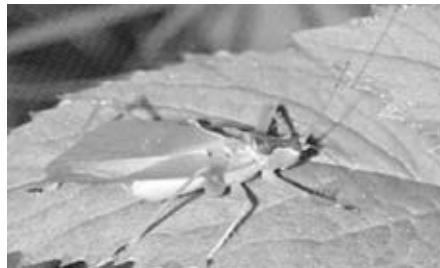
ハヤシノウマオイ