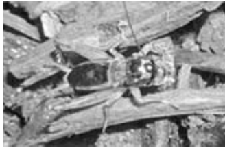
ツツレサセコオロギ