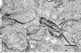
ミツカドコオロギ