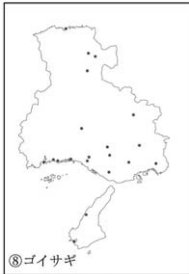
図2 兵庫県内のカワウ・サギ類 種別コロニー分布図