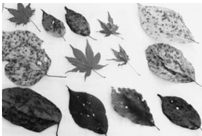
アジサイなどの病気

結果は、カエデは糸状菌による「小黑紋病」と鑑定があり、アジサイの葉は私たちの試料の扱いに知識がなく不十分で鑑定できなかったのですが何かの「病気」らしいことが分かりました。われわれとしては意外な結果でありそれが真実だったのです。