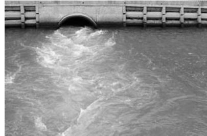
神戸製鋼所の排水口

町に「エーゲ海」が現れたようなこの現象は、窒素等を含む排水によりプランクトンが増え死骸が海の深層部に蓄積します。その死骸が分解して海水の溶解酸素を奪い「無酸素」状況にして硫化水素を発生させます。その硫化物イオンを含む深層水が海面に浮き上がると「青白く」発色するわけです。