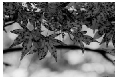
カエデの黒色の斑点

この病気は六甲山の一部で見られ、市立森林植物園など他の地区ではまったく見られないなどの特徴があります（地図を見てください）。原因は分かりませんが、いずれにしても六甲山の一部の植生が弱っているということです。