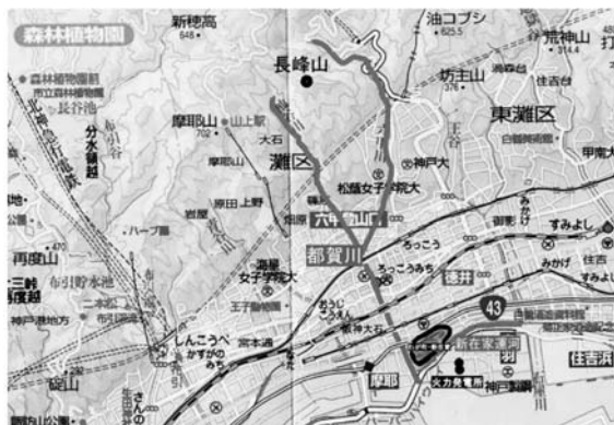
地図：都賀川とわが町

2004年には県の「都賀川の治水改造と遊歩道等の整備」が完成し灘区の皆さんの散歩道として愛されています。