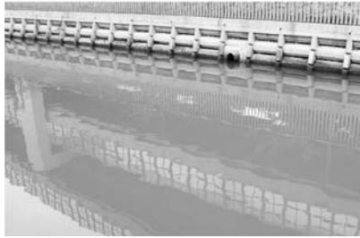
新在家運河の青潮

わが町の南側に「新在家運河」があります。下町の桜の名所ともいわれています。時期により極度に「青く白濁した」珍現象が現れます。神戸製鋼所の排水が青白に濁るのですが、調査を神戸市等に依頼し神戸製鋼所に問い合わせしました。結果は「青潮現象」でした。