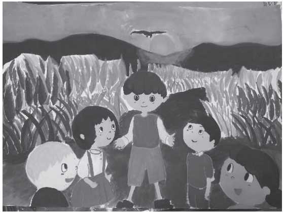
『ゆうたくんとイヌワシ』（一部）