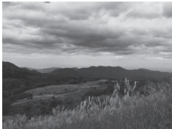
兵庫県新温泉町上山高原

紙芝居の制作は話を作ることが得意なメンバー、絵を描くことが得意なメンバーが中心となり、話の内容、ストーリー、絵など、かわせみの会の皆様、布野先生にアドバイスをいただきながら、ほぼすべてをいきものずかんで制作しました。