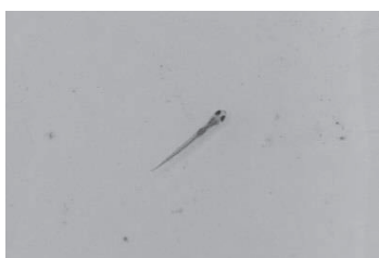
図6 カワバタモロコ稚魚 (平成26年6月2日)

地域住民の方への聞き込み調査で、カワバタモロコが大雨後に浅瀬で産卵するという情報を得た。校内ビオトープにおいては池の水位が大きく下がった6月上旬頃に、カワバタモロコに婚姻色が見られた。また、池の水位が上昇した頃に浅瀬で産卵、その後稚魚を確認した(図6)。稚魚は成長していく段階で(図7および8)、池の上層から下層へと生息域を移動する傾向が見られた。なお、産卵および稚魚が成長し移動するまでの、池の各深さ別平均水温は、上層で25.8℃、中層で23.9℃、下層で21.7℃であった。カワバタモロコの稚魚は水温27±1℃で生存率が高く、成長が良いと報告されている(高久ら、2008)。今回の調査では、カワバタモロコの産卵が見られた浅瀬の平均水温は25.8℃であった。このことから、三田市に生息するカワバタモロコが大雨後に浅瀬で産卵する理由として、水位上昇でできた浅瀬が稚魚の成育に有意な水温となりやすいことが原因である可能性が考えられた。また、今回校内に設置したビオトープでカワバタモロコ繁殖・保護が可能であることが分かった。今後、婚姻色が現れる条件について調査をしたい。