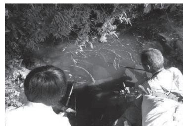
図3 地域の池の環境調査

平成27年から平成29年に、地域の方と協力し絶滅危惧種であるカワバタモロコの繁殖・保護を行った。カワバタモロコの生息する池で産卵に適した環境について地元住民への聞き込みおよび現地調査を行った（図3）。カワバタモロコ保護・繁殖の場所として校内に自然物を利用したビオトープを製作、カワバタモロコ産卵と水温および水位の関係性について調査した。