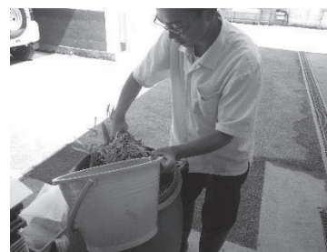
図4 竹パウダーぼかし作成中

平成28年および平成29年に、校内にて剪定枝や竹の利用した作品を製作し、展示を行った。また竹の有効利用として、竹パウダーを用いた残渣処理および野菜の栽培に関する調査を行った。竹パウダーを用いた残渣処理では、竹パウダーに農業残渣を加え、毎日攪拌を行い残渣の分解の様子を調査した。なお、残渣投入は、2日に1回程度1か月間行い、1回あたりの投入量の目安を調査した。竹パウダーを用いた野菜の栽培の検討では、竹パウダーぼかしを製作し（図4）、トマト、スイカ、ベビーサラダおよび黒豆栽培の元肥および追肥として施肥し、その効果を調査した。