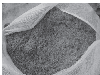
図10 竹パウダーぼかし

断した。今後残渣処理に使用する竹パウダーの量を増やすことで、1度により多くの残渣を処理できる可能性があると考えた。竹パウダーぼかし(図10)を用いたトマトおよびスイカ栽培では、いずれも慣行栽培と比べ糖度が上昇する傾向が見られた。しかし、黒豆やベビーサラダ栽培では収量が減少する傾向が見られた。また、いずれの作物においても害虫が多く見られた。竹パウダーぼかしを用いた野菜栽培は可能であるが、成分も含めさらなる調査が必要であると考えられた。