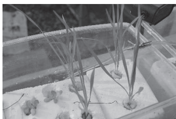
図5 水槽での実験の様子

水槽での調査(図5)の結果、根の周りに濁りの原因と思われる物体が付着し、水の濁りが減少されていた。植物を水上に浮かべることで、当初と比べポイ捨ての量が日に日に減っていった。誰かが池の管理をしているという風景、またゴミを池からなくすことで、捨ててもいい場所という認識が薄れたのかもしれない。今後も、ゴミのない綺麗な環境になるようにしていきたい。