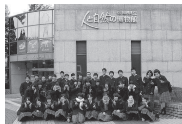
図1 人と自然科の生徒 (人博連携セミナーにて)

人と自然の博物館との連携セミナーを通して、有馬高校人と自然科の生徒は多くのことを学んできた（図1）。また、その学びから探求することで見える新しい世界があるということに気付くことができた。その結果、平成26年から平成29年に生徒主体で広がった3つの活動事例を報告する。