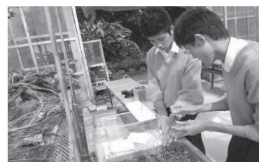
図2 筏に植物を設置する様子

平成26年に学校前の池の景観改善を目的に、ゴミを捨てにくい環境づくりとしてゴミ拾いや水上花壇の設置に取り組んだ。水耕栽培技術を利用し、水槽に池の水を採取し、植物を浮かべ水の濁りの変化について観察を行った。水上花壇では、発砲スチロールで筏を製作、グラス、パンジー、レタス、ルッコラ等の植物を筏に設置し（図2）、池に浮かべた。