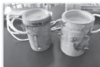
図9 竹を使った展示作品

校内の剪定枝や竹を利用した作品展示は好評で、自然を親しみきっかけとなった(図9)。竹パウダーを用いた残渣処理では、10kgの竹パウダーで約4kgの残渣を処理することができた。1回の残渣投入量を30gから850gまで試したところ、水分が多すぎると発酵が遅くなる傾向が見られたため、1回あたりの残渣投入量は竹パウダー10kgに対して300g前後が適当であると判