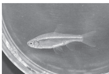
図7 カワバタモロコ (平成26年6月27日)